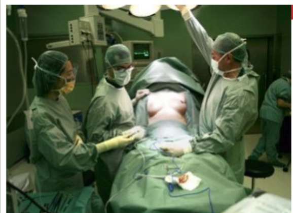
L'augment de pit continua sent l'operació d'estètica amb més demanda a Catalunya Foto: ARXIU.

Els experts afirmen que no han detectat en els últims anys un augment del nombre de pacients joves i situen la mitjana d'edat en 38 anys. A més, el 23% dels pacients són reincidents, ja que s'han sotmès a altres intervencions. D'altra banda, els metges alerten contra solucions miraculoses a baix preu que ofereixen centres sense professionals qualificats.