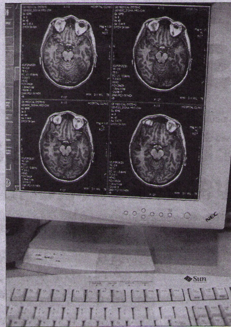
Les proves d'imatge són les més utilitzades per diagnosticar l'Alzheimer

El diagnòstic de l'Alzheimer encara és un repte, ja que no es disposa de proves que confirmin o descartin la malaltia de manera totalment definitiva quan el pacient encara és viu. No obstant això, existeixen biomarcadors -indicadors genètics- que permeten detectar alteracions que es produeixen abans que la malaltia es manifesti. Per un diagnòstic amb aquesta tècnica -actualment s'utilitza en recerca- costaria entre 600 i 1.000 euros per pacient. Tot i que el cost és, ara per ara, elevat, els experts insisteixen en la necessitat d'impulsar aquests procediments. ■